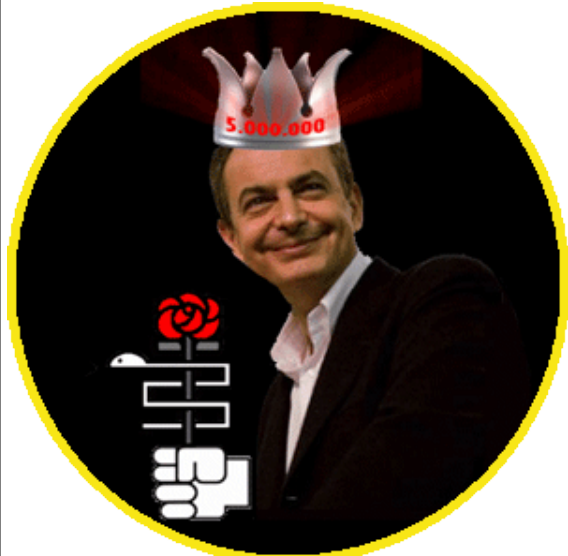
José Luis Zapatero