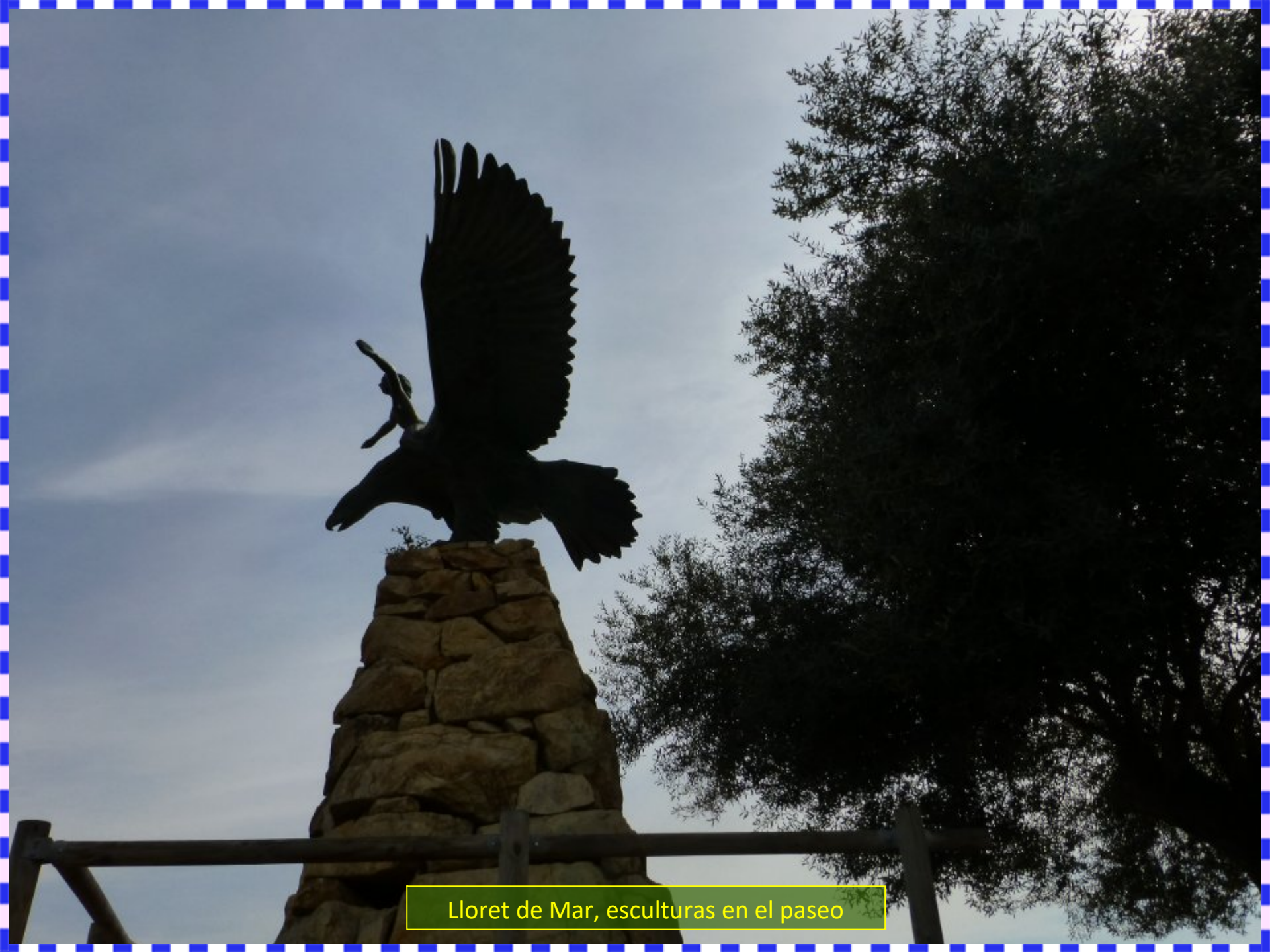
Lloret de Mar, esculturas en el paseo