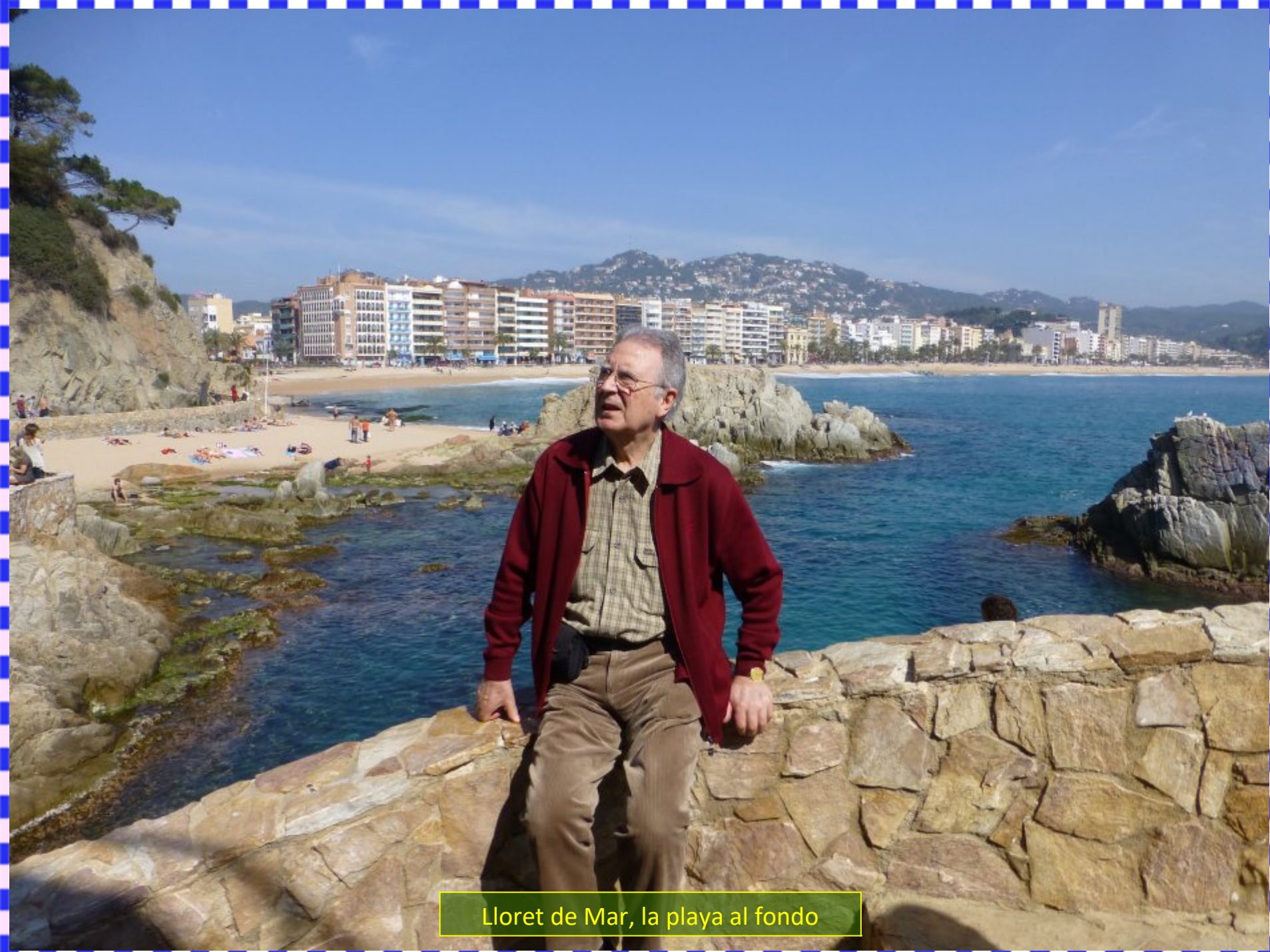
Lloret de Mar, la playa al fondo