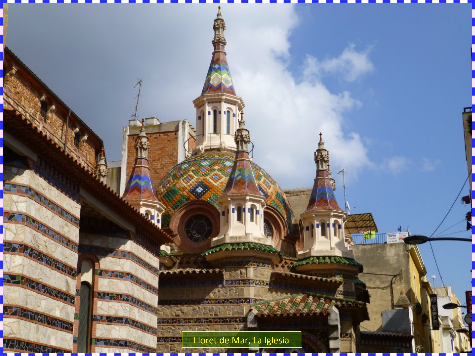
Lloret de Mar, La Iglesia