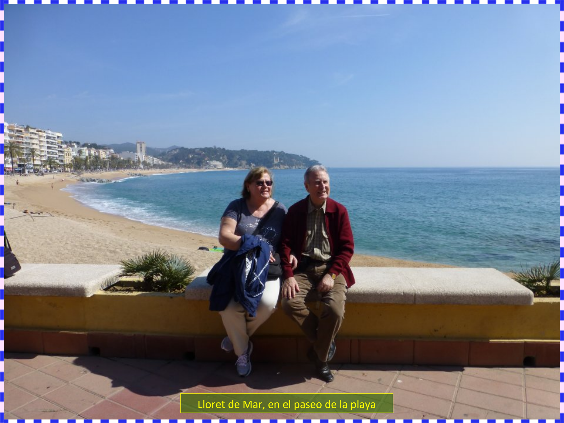
Lloret de Mar, en el paseo de la playa