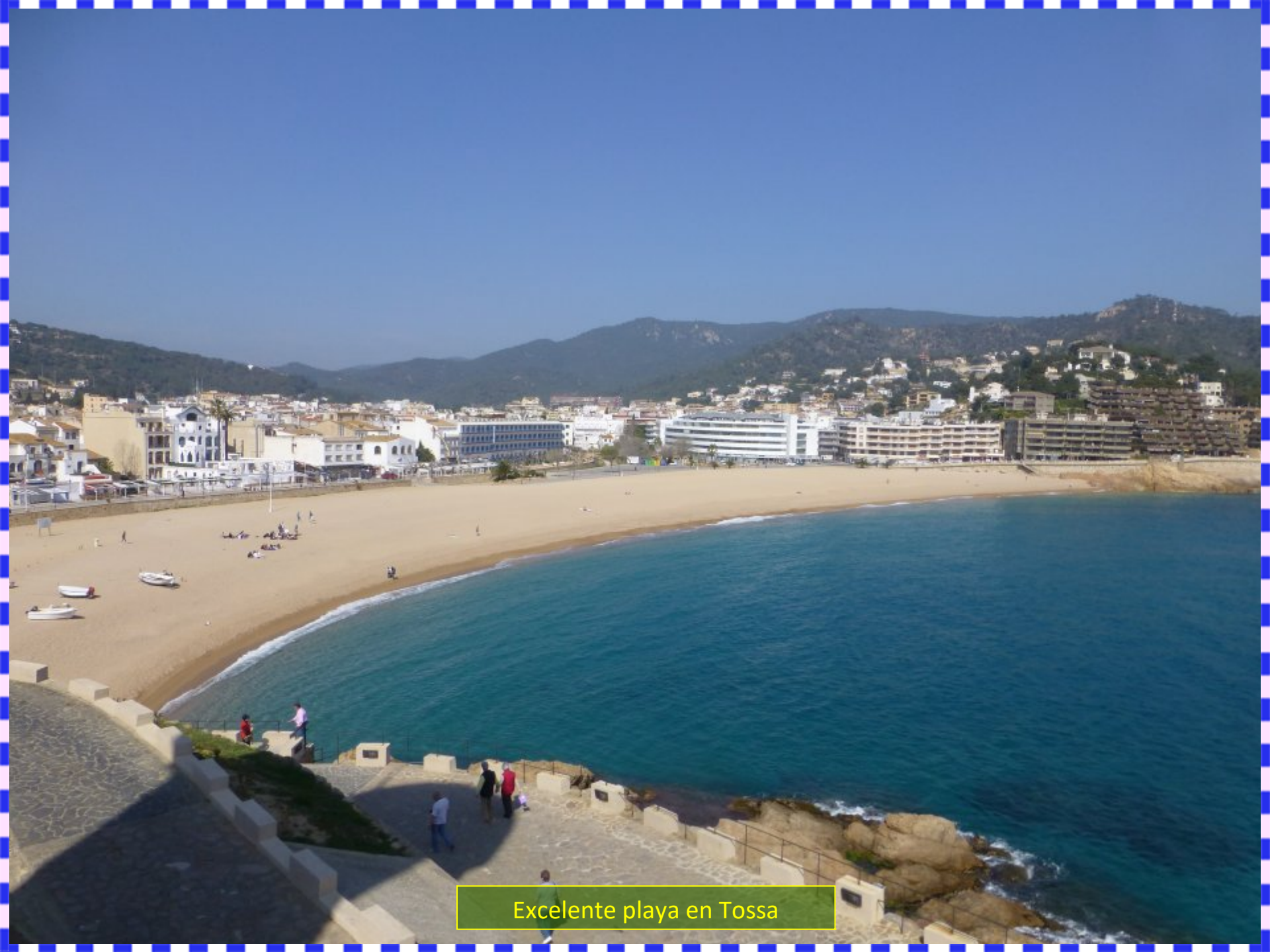
Excelente playa en Tossa