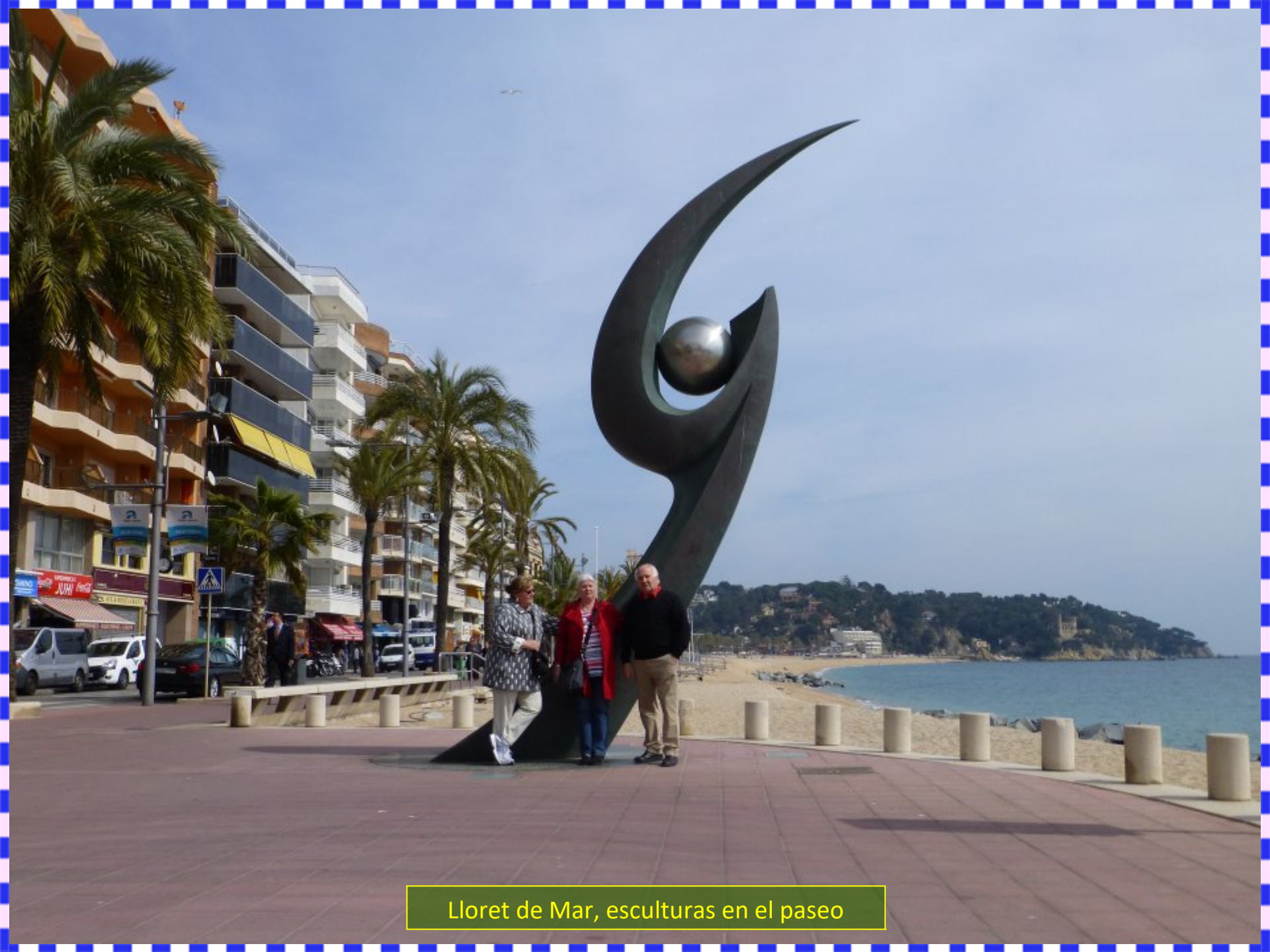
Lloret de Mar, esculturas en el paseo