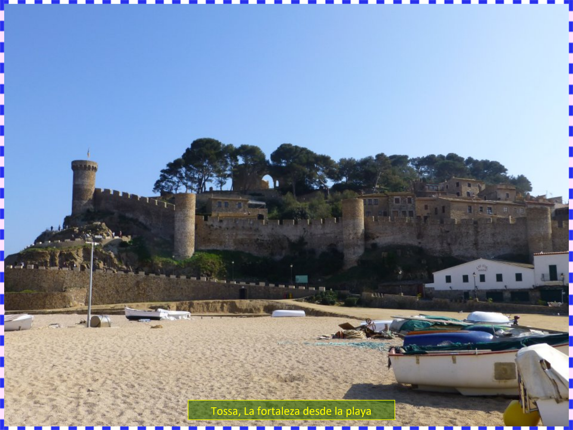
Tossa, La fortaleza desde la playa