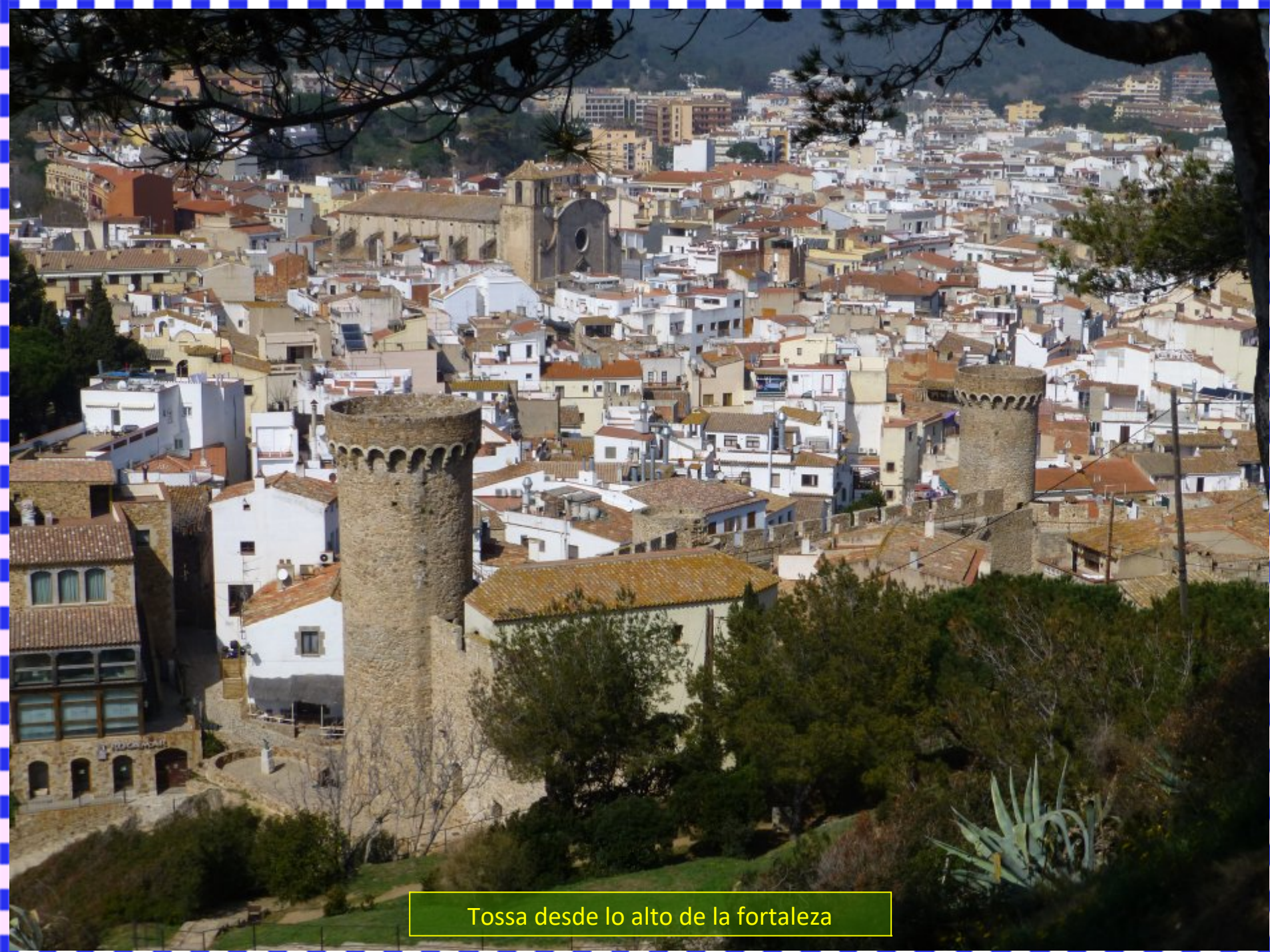
Tossa desde lo alto de la fortaleza