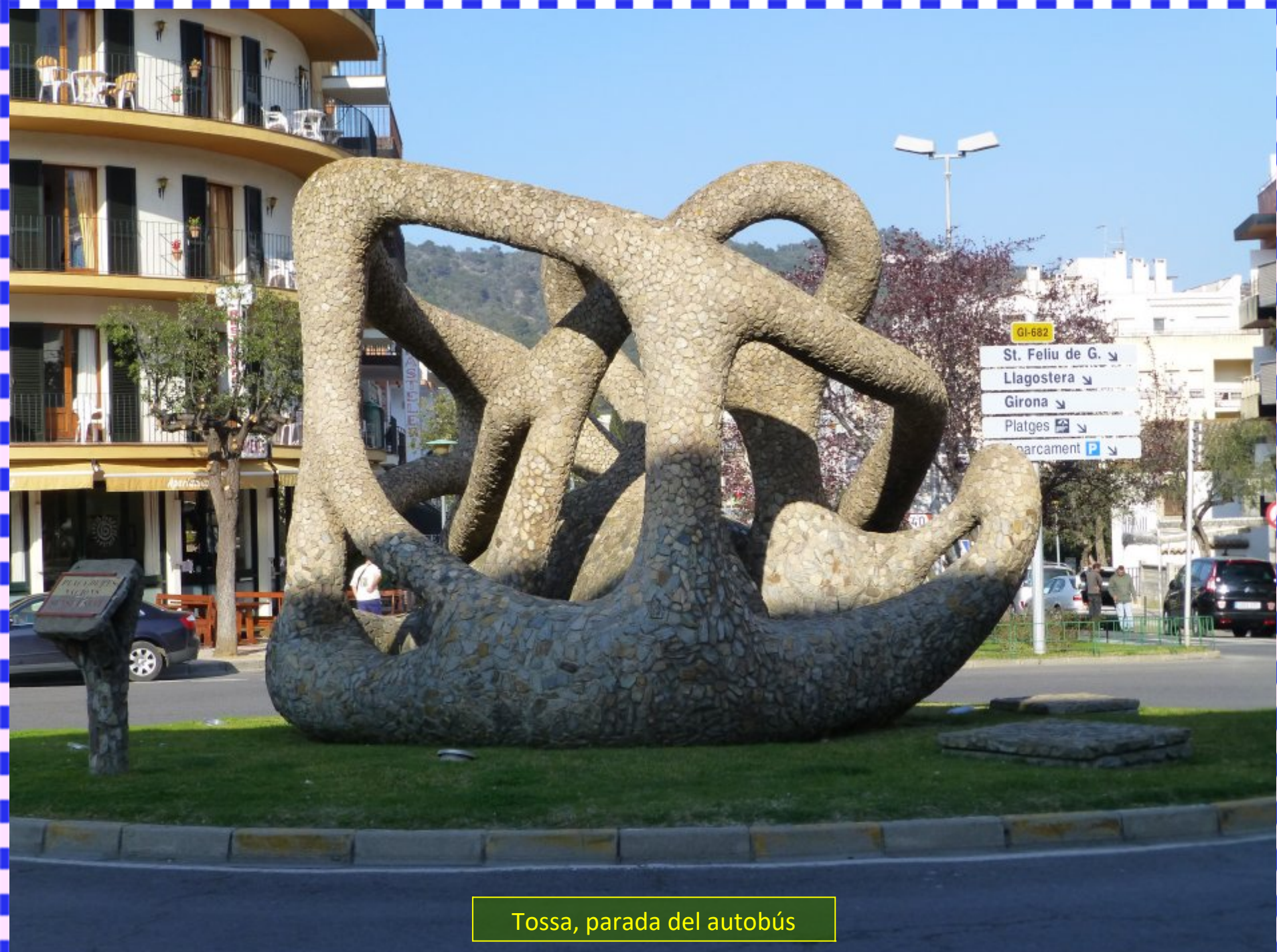
Tossa, parada del autobús