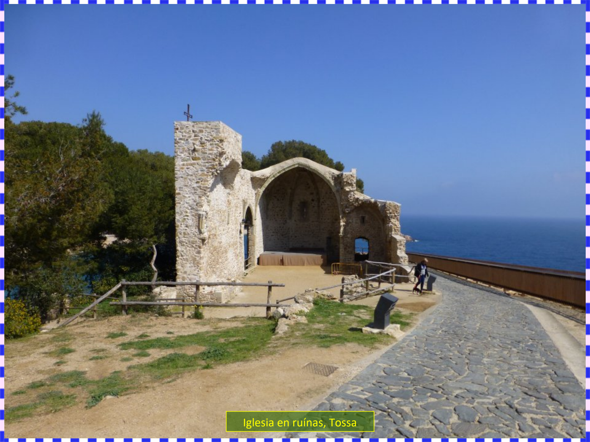
Iglesia en ruínas, Tossa