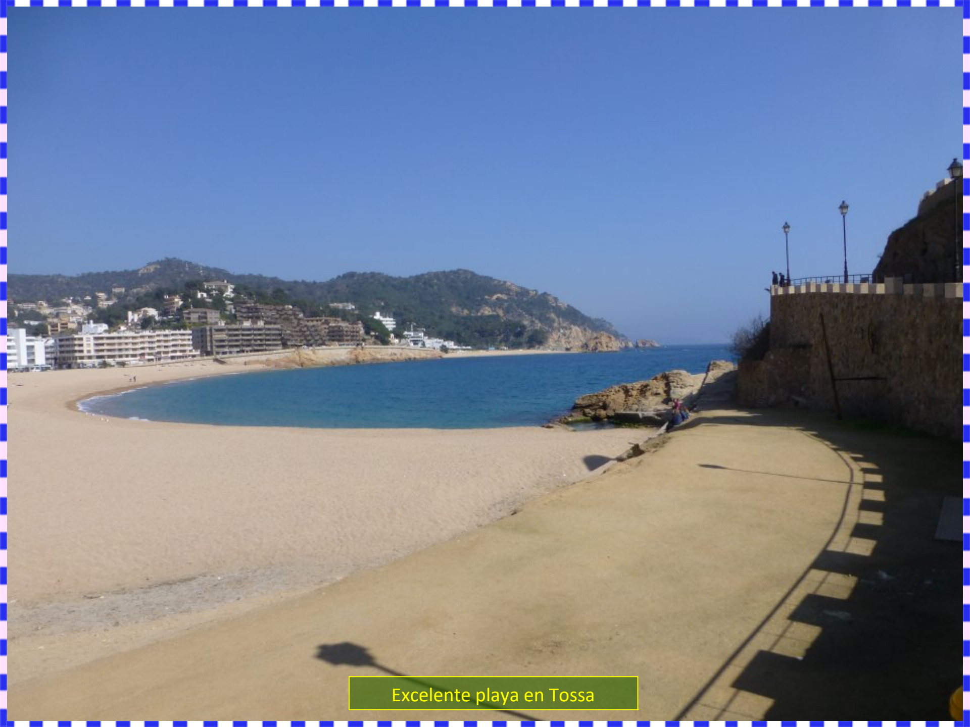
Excelente playa en Tossa