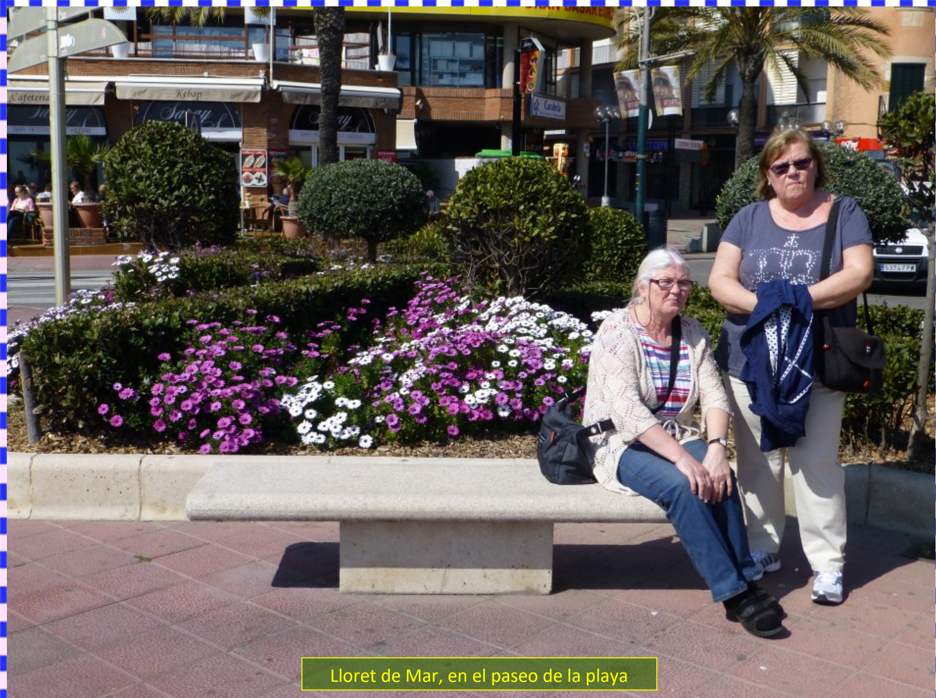
Lloret de Mar, en el paseo de la playa