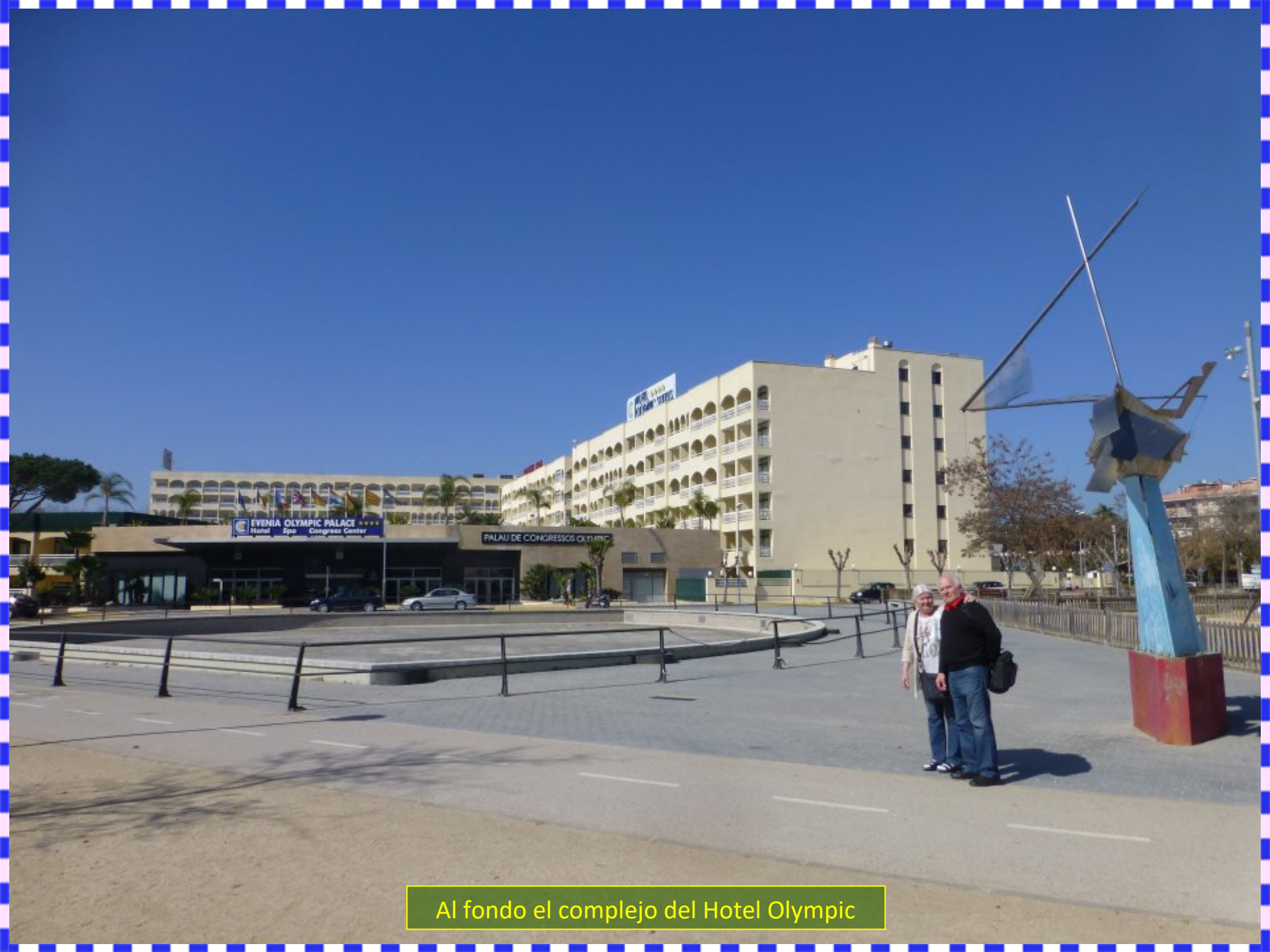
Al fondo el complejo del Hotel Olympic