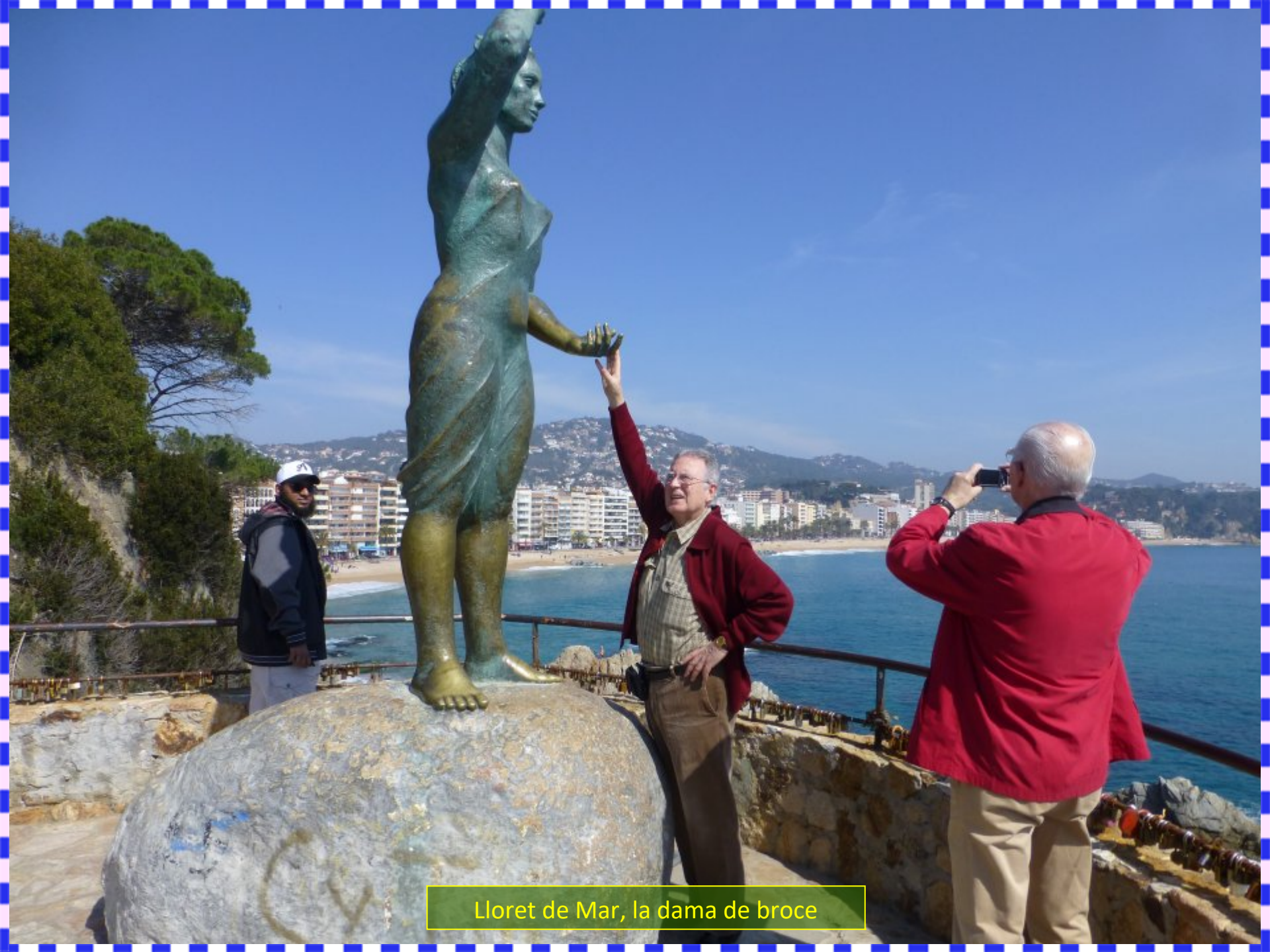
Lloret de Mar, la dama de broce