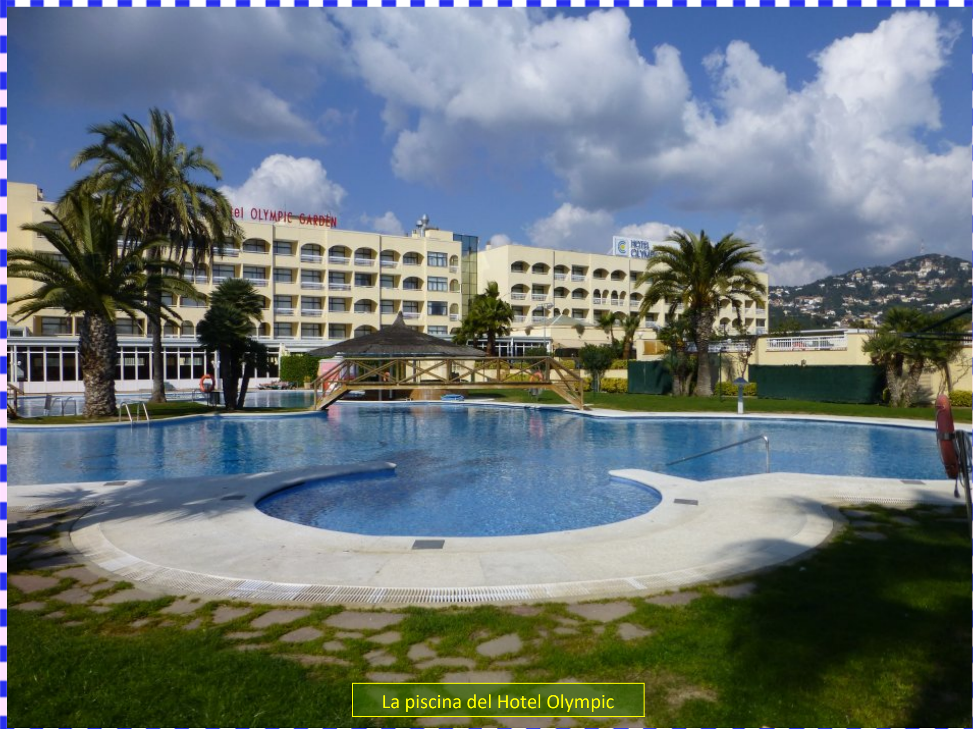
La piscina del Hotel Olympic