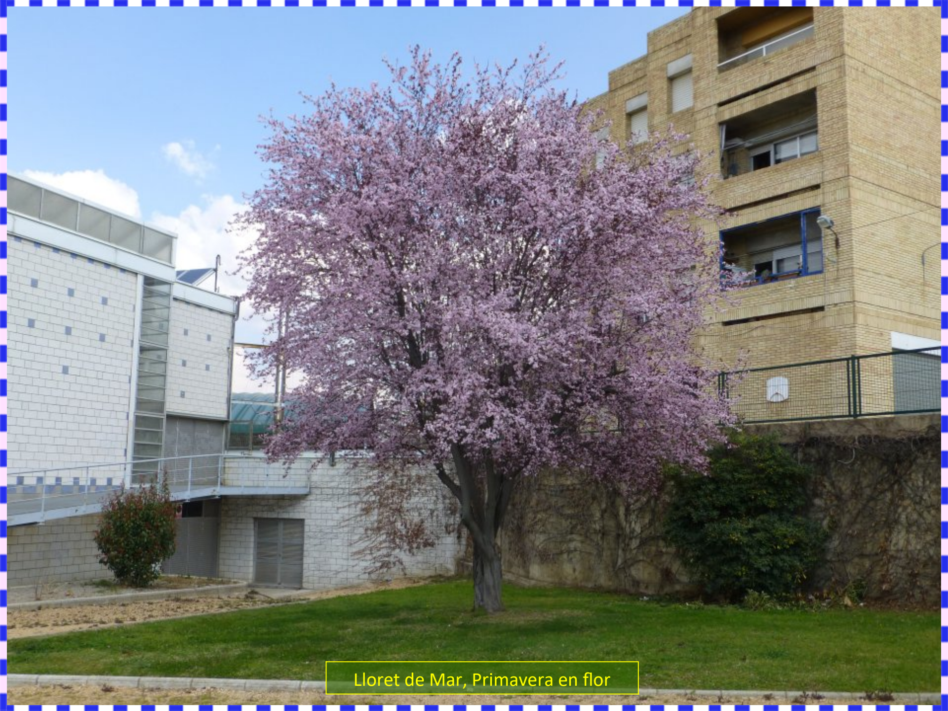
Lloret de Mar, Primavera en flor