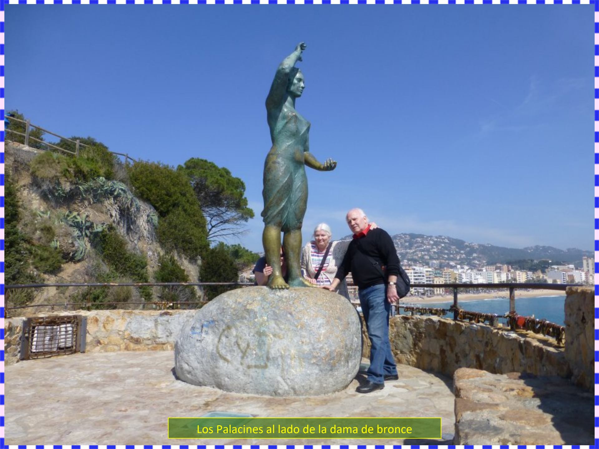
Los Palacines al lado de la dama de bronce