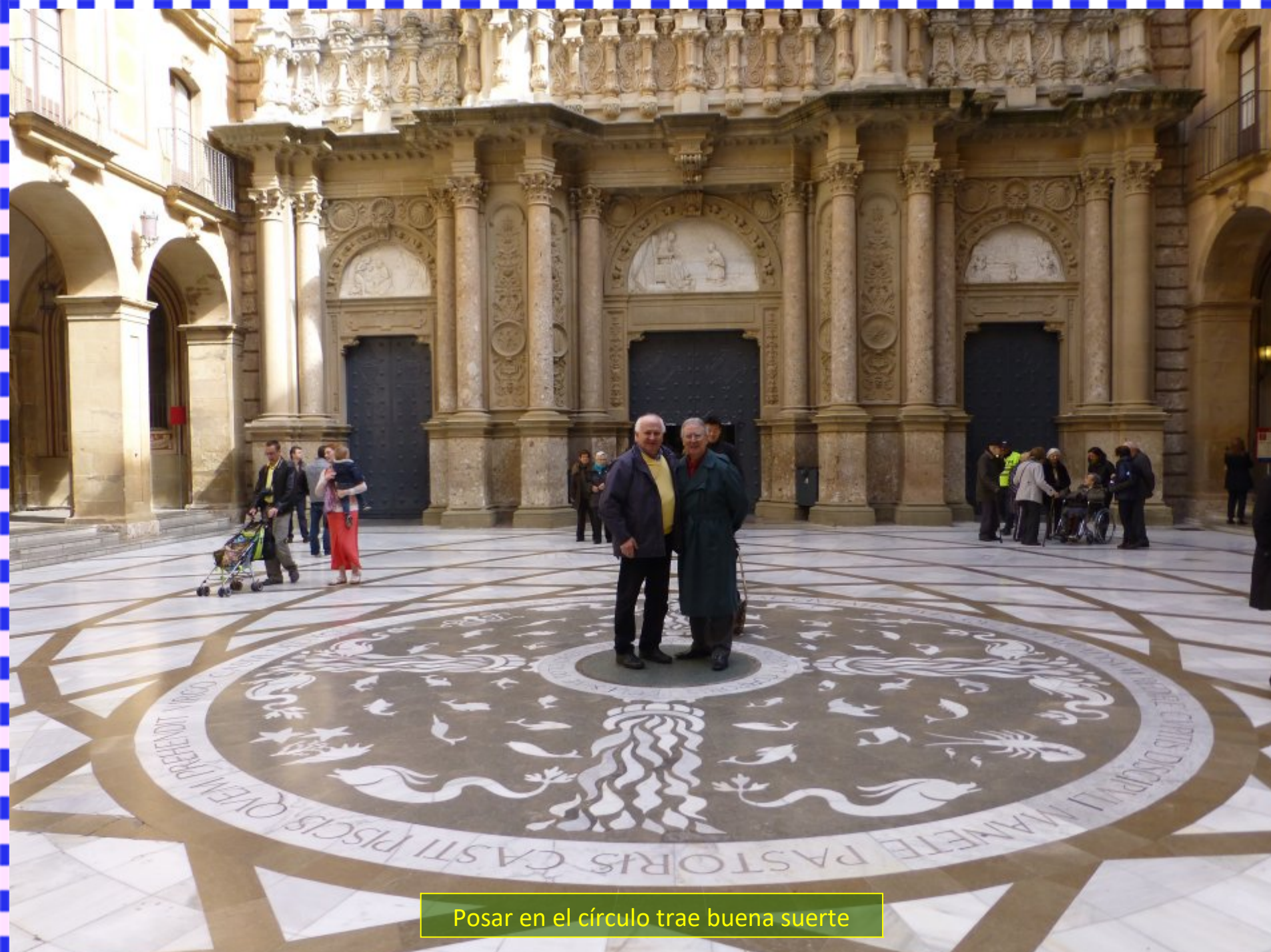
Posar en el círculo trae buena suerte