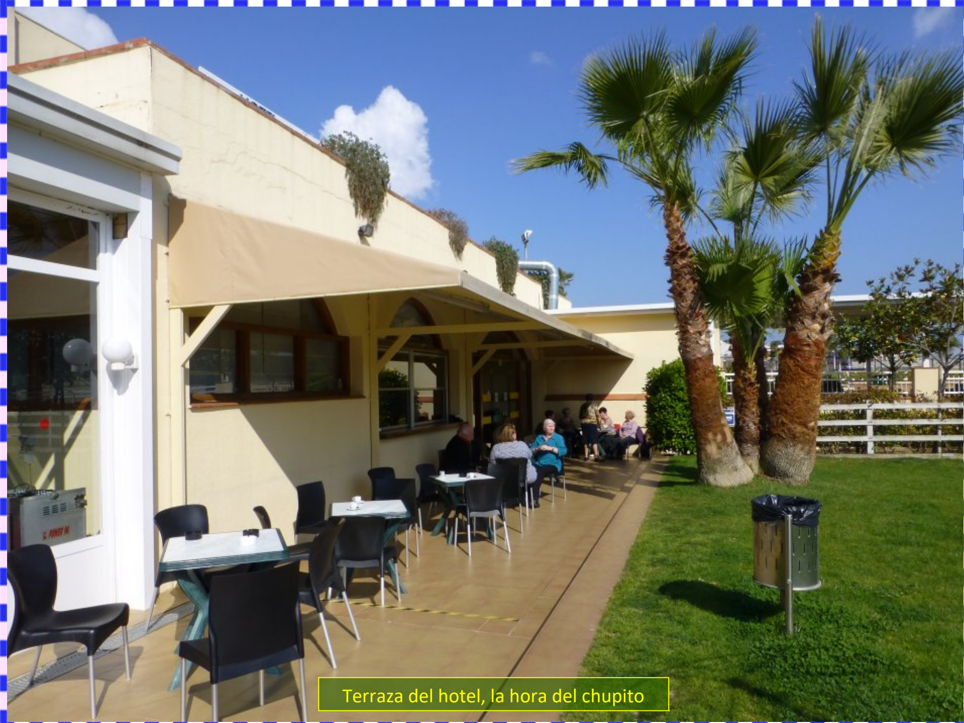
Terraza del hotel, la hora del chupito