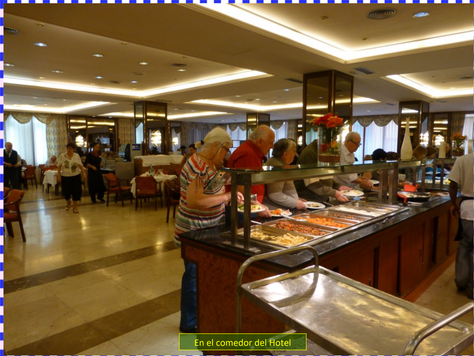
En el comedor del Hotel