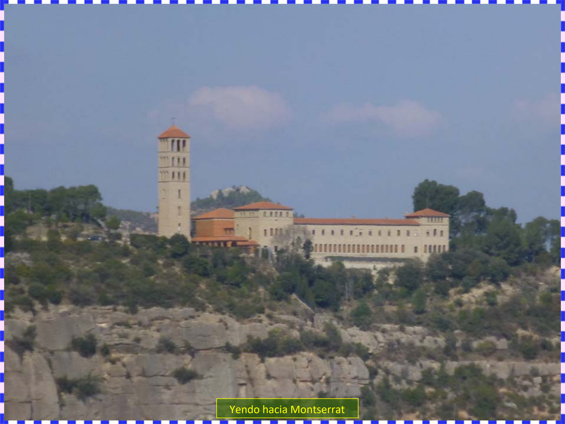
Yendo hacia Montserrat