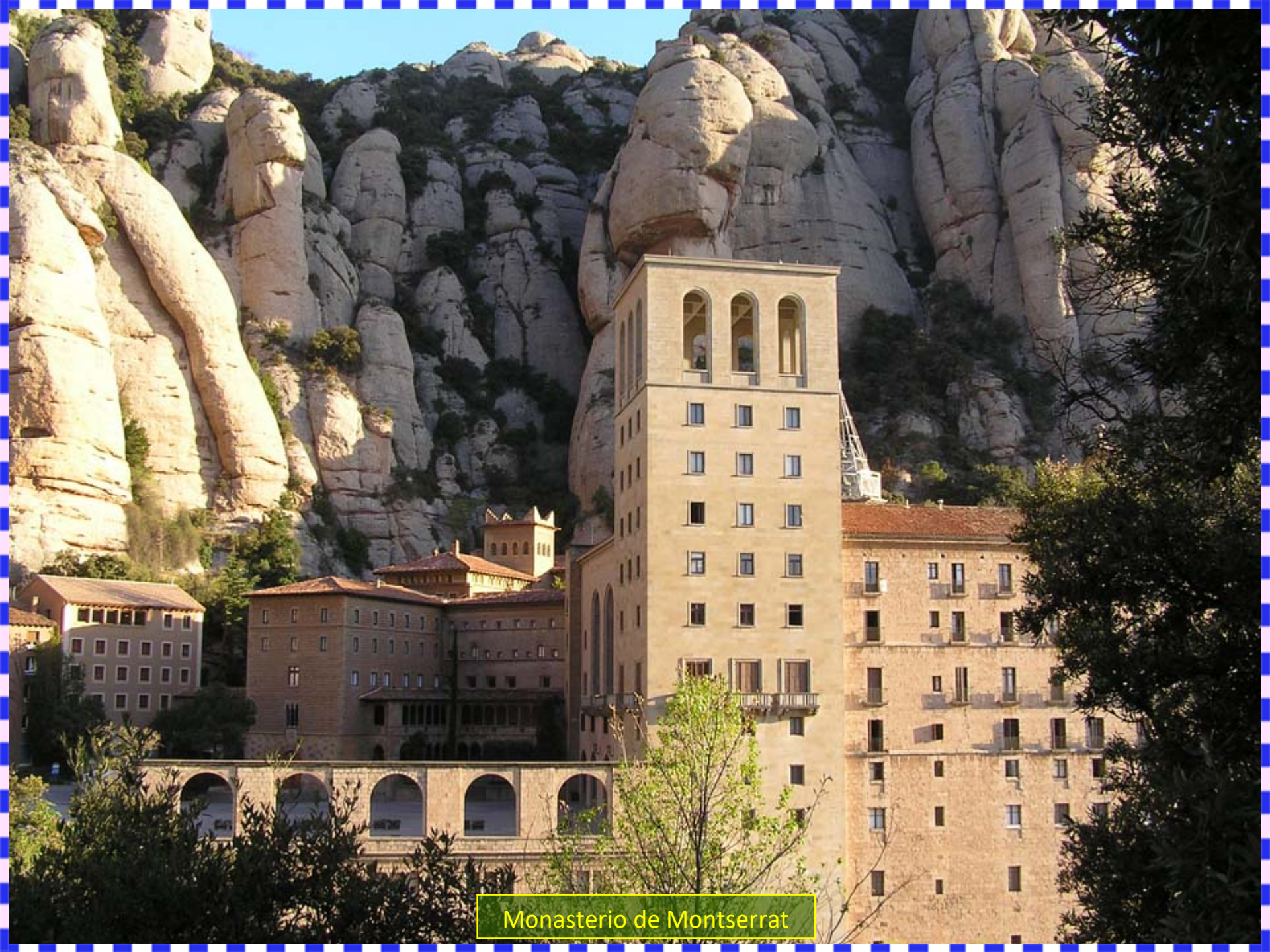
Monasterio de Montserrat