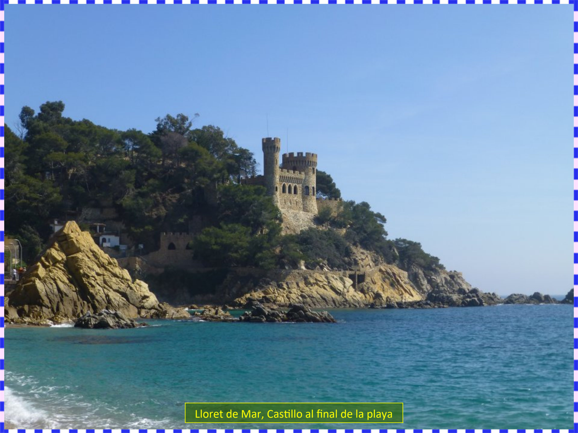
Lloret de Mar, Castillo al final de la playa