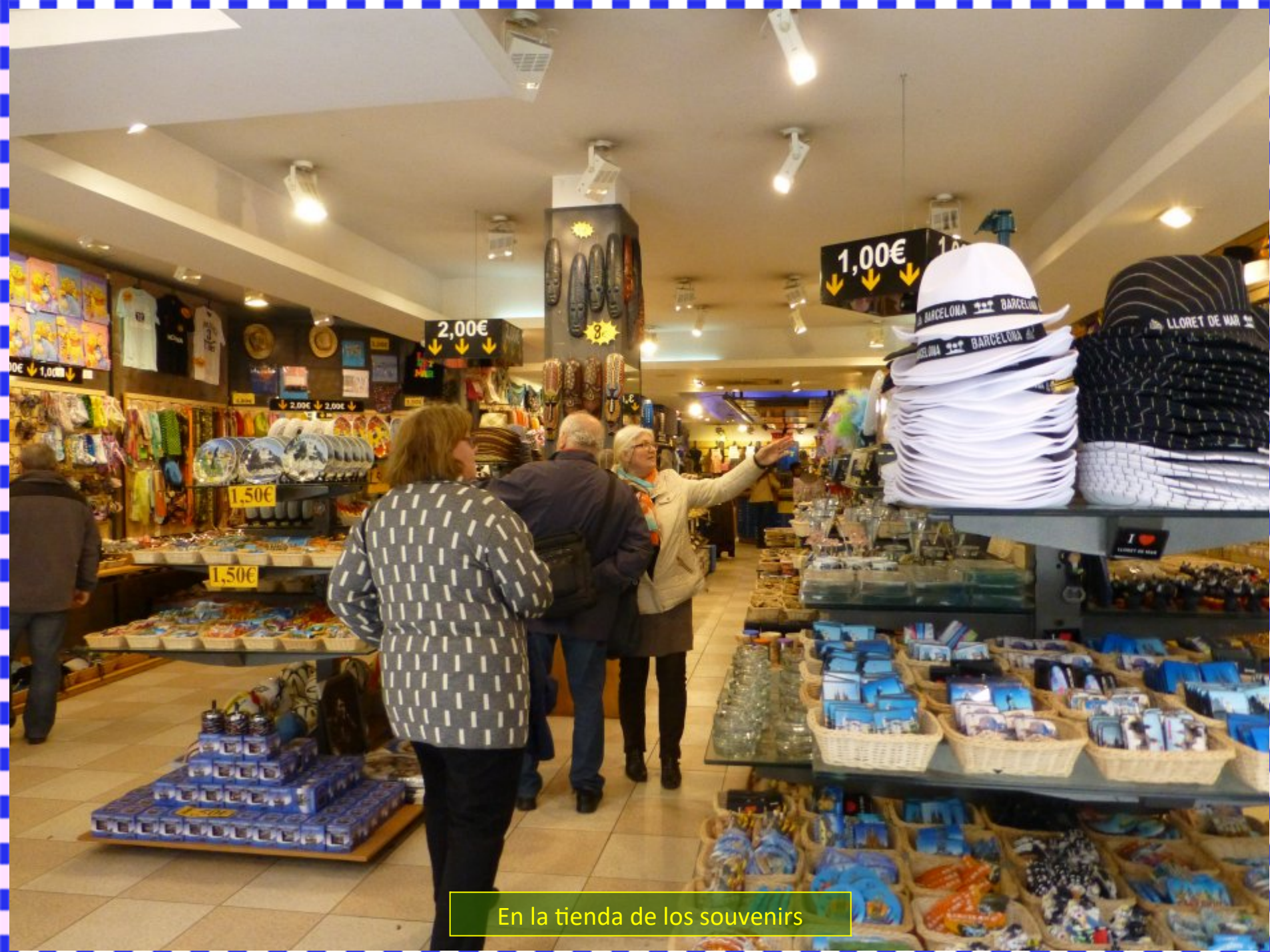
En la tienda de los souvenirs