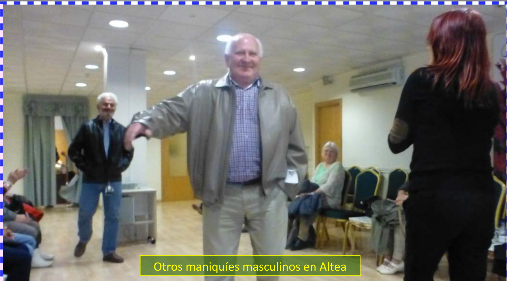
Otros maniqués masculinos en Altea