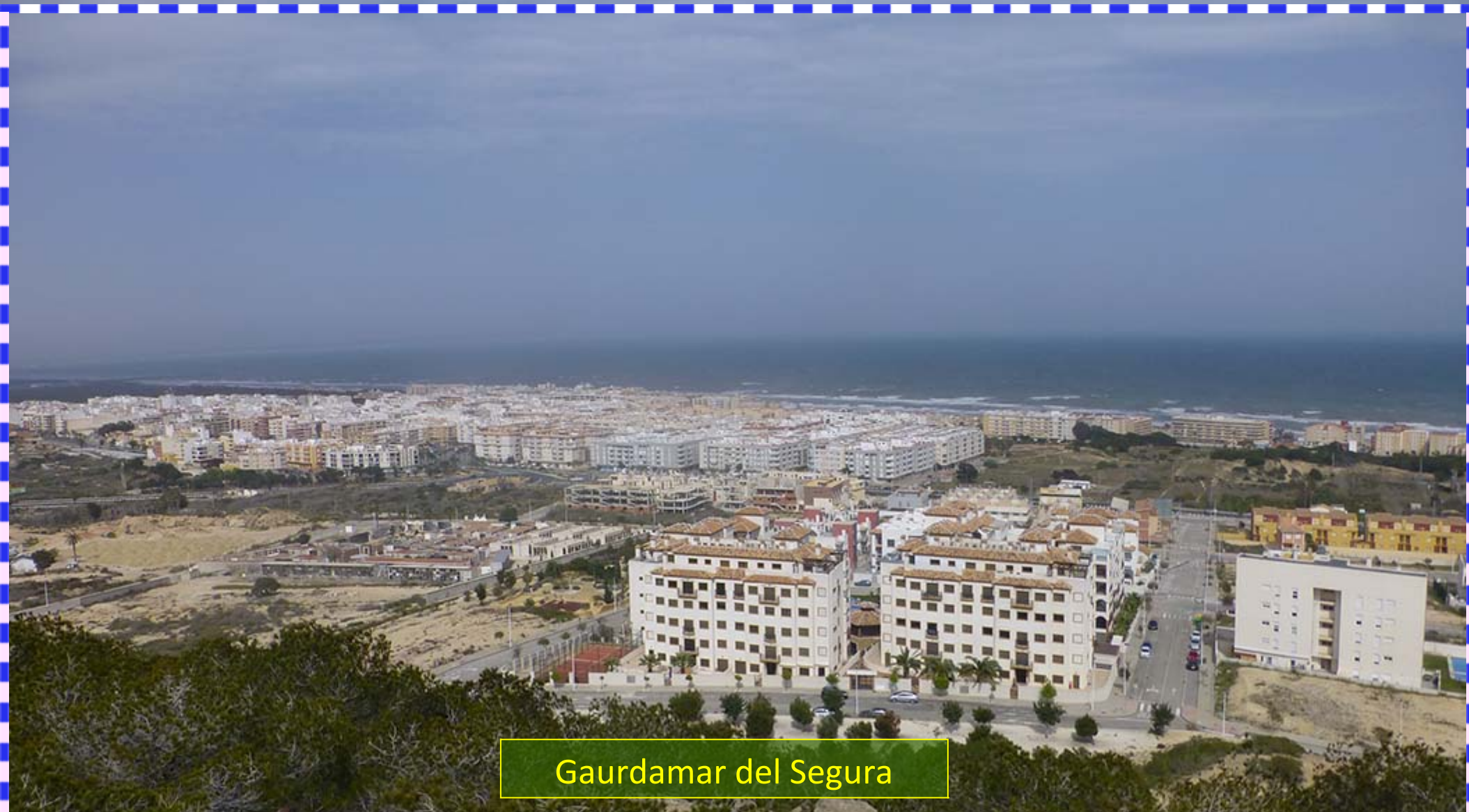
Gaurdamar del Segura