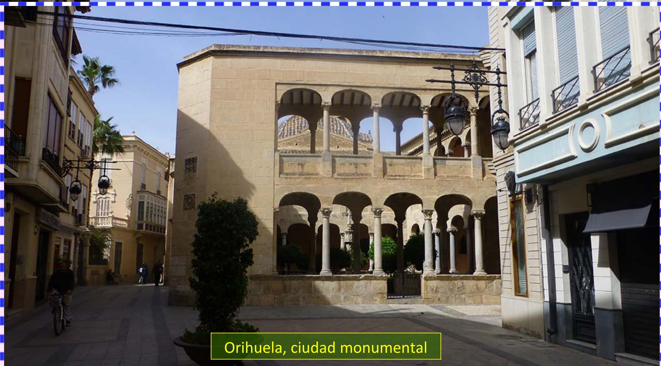
Orihuela, ciudad monumental