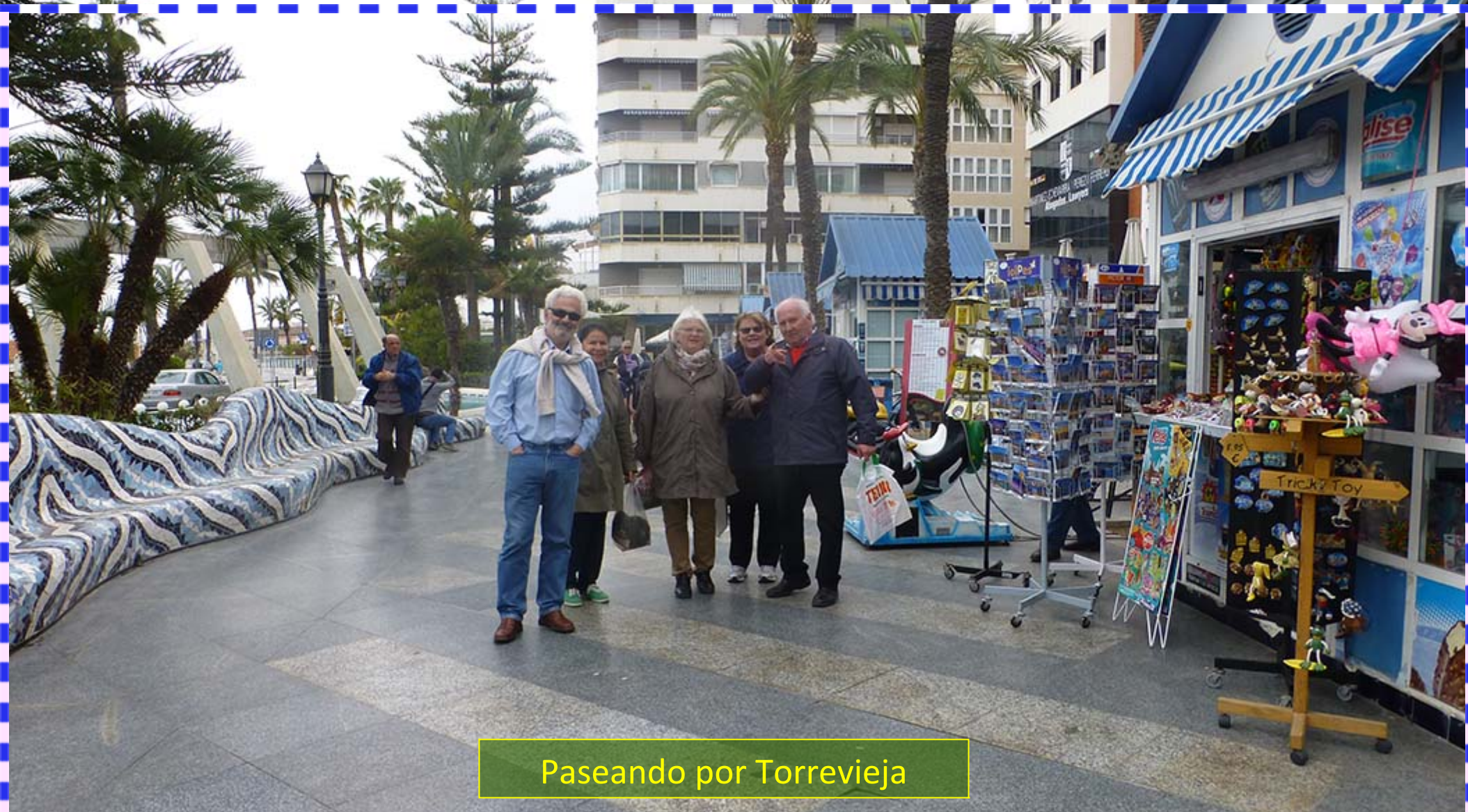
Paseando por Torrevieja