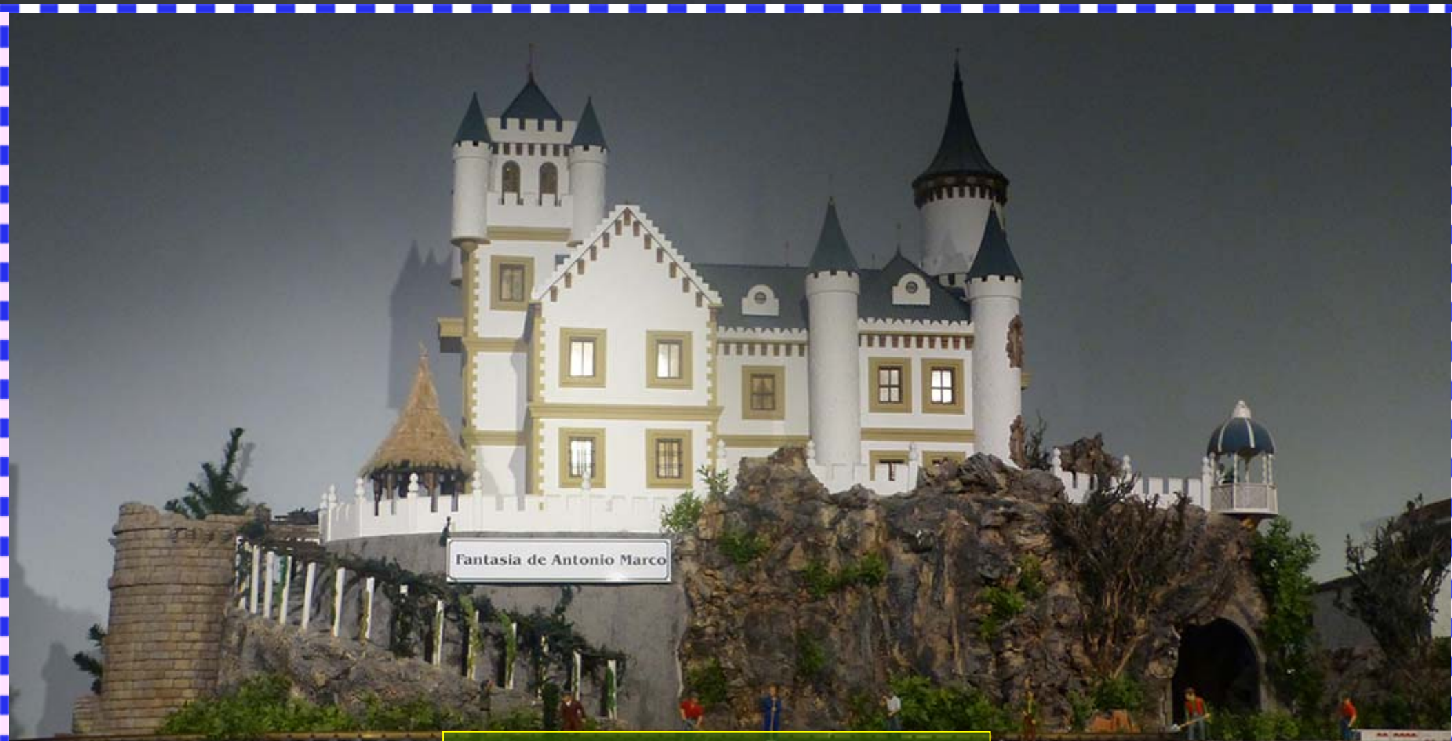
Mueso de miniaturas en Polop