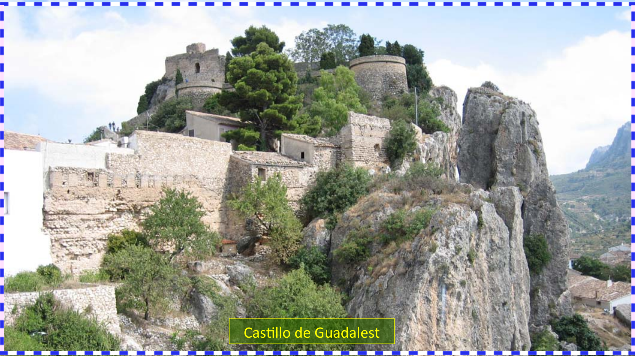
Castillo de Guadalest