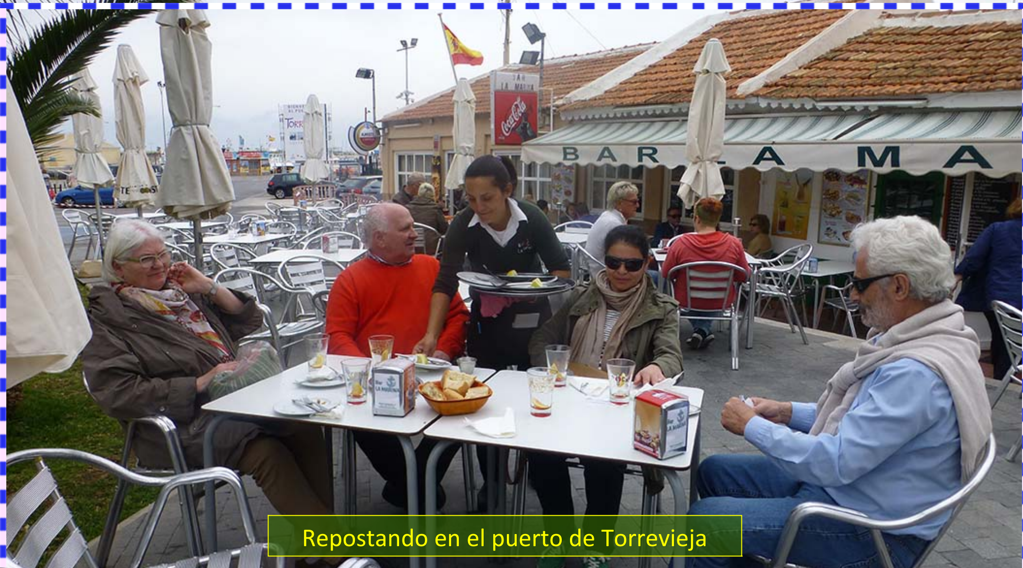
Repostando en el puerto de Torrevieja