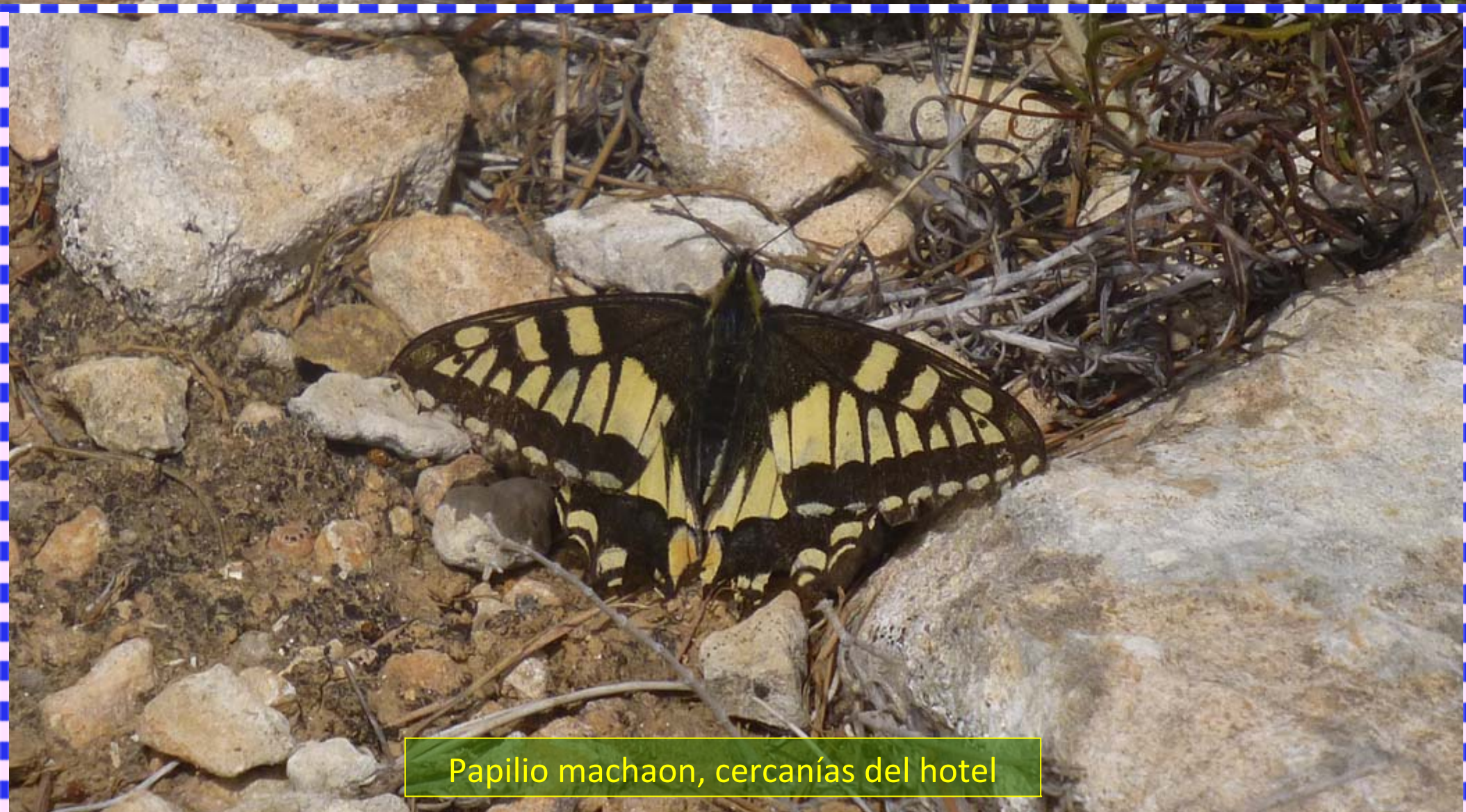
Papilio machaon, cercanías del hotel