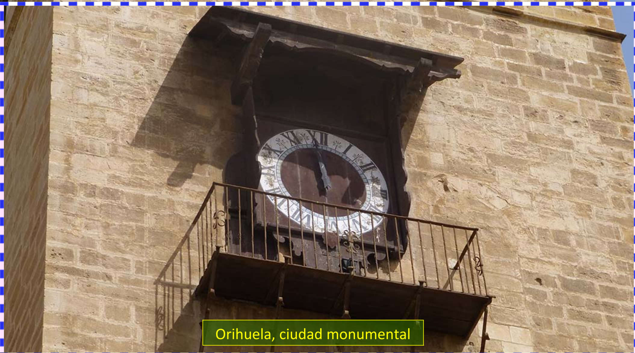
Orihuela, ciudad monumental