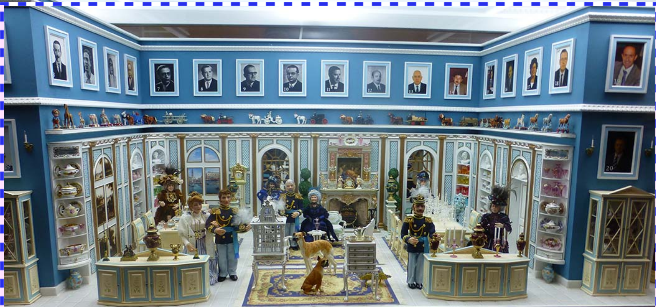
Mueso de miniaturas en Polop