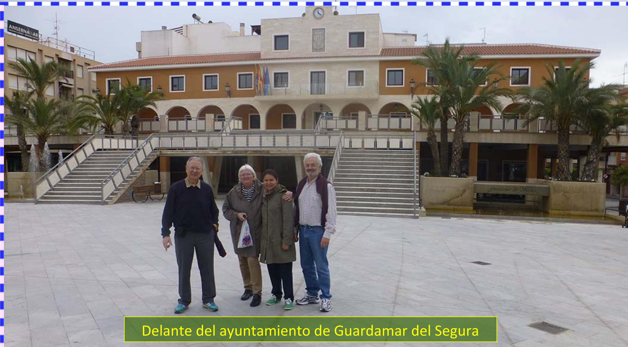
Delante del ayuntamiento de Guardamar del Segura