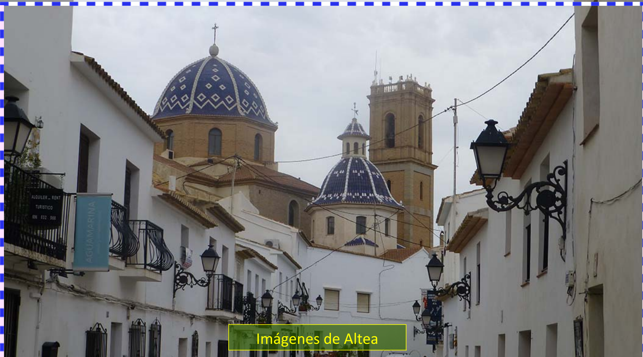
Imágenes de Altea