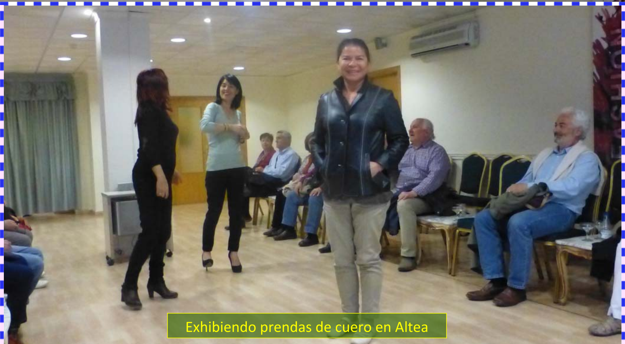
Exhibiendo prendas de cuero en Altea